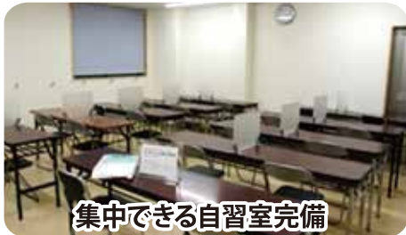
集中できる自習室完備