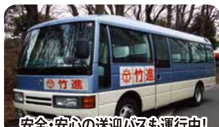
安全・安心の送迎バスも運行中！

送り迎えが困難な方、通学中の安全が気になる方のために、時刻・バス停をきめ細かく設定した送迎バスを運行しております。