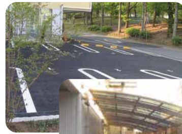
駐車場・駐輪場完備

監視カメラと連動した警備システム セキュリティ強化の為、監視カメラを建物周辺に複数台設置。お子様の安全に配慮した、不審者対策も万全です。