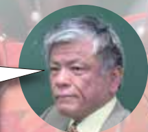
「ザ・プロフェッショナル」 渡部塾長

メイン講師が講義を行っている中、サブ講師が巡回して生徒の理解度チェックや適切なアドバイスを行うので、内容の濃い授業となっています。問題演習中の個別指導も、1人担任と比べて倍以上の密度と言えます。