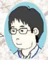
英語担当 M先生がおえ

英語 ここにこだわる! 文法を骨まで沁みるほどしっかりと理解させるノウハウがあります。入試問題の徹底的な分析と対策で安定した成績を誇っています。講師陣の英語力の高さも自慢。ぜひ体験しに来て下さい!