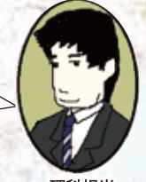
理科担当 B先生がおえ

理科 ここにこだわる! 授業では常に、イラストや表をまじえながら、生活の中の自然な疑問の延長上に教科書の内容があるのだということを強調しています。理科には理解の仕方があります。覚え方の順序があります。暗記も苦にならない楽しい理科を体験しに来て下さい!