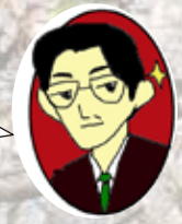
数学・算数担当 T先生がおえ

数学・算数 ここにこだわる! 授業では、一つの内容を、何度も繰り返し、“本当に身につく”まで、しっかりと練習します。80分あっという間に終わってしまいますよ。