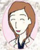
国語担当 B先生がおえ

国語 ここにこだわる! どんな問題を解くときも、大切なのは「何が問われているか」を読み取る読解力です。それを把握した上で、解答をつくる材料を、本文中から注意深く探しましょう。