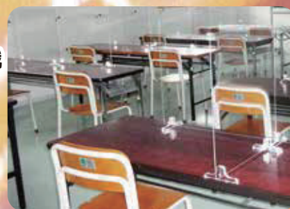
集中できる自習室完備 管理の行き届いた自習室を完備しています。

小5・6で土一・竹園高校に合格させたい方は、 「土一・竹園高校トップ合格先取り」クラスがお勧めです。学力別のクラス編成となり、中学受験 レベルの高度な内容を扱います。お子様の知的好奇心を刺激しましょう！